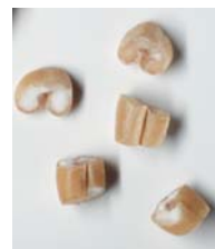
Пшеница, мелкая крупа