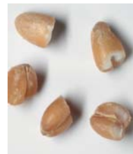
Пшеница, грубая крупа