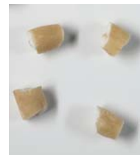
Овес, мелкая крупа