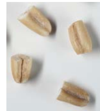
Овес, грубая крупа