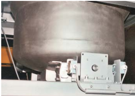
Wägebehälter der Dosierwaage