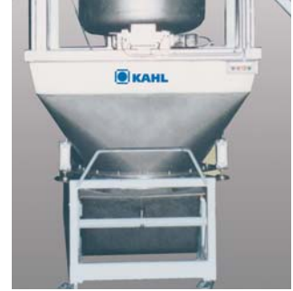
Dosierwaage mit 30 kg Wägefähigkeit