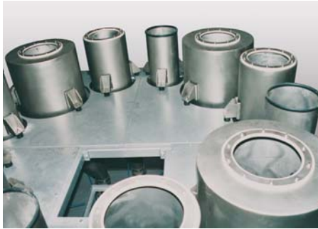
Dosierbehälter mit 4 Behältern a 80 Liter, 4 Behältern a 160 Liter und 4 Behältern a 360 Liter