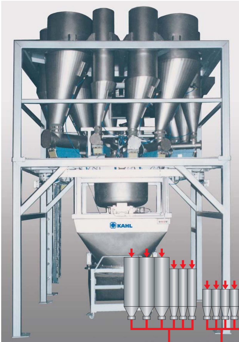
KAHL Mikrokomponenten Dosier- und Wägeanlage für 12 Komponenten mit einer 30 kg Waage.

Dosier-, Wiege- und Misanlagen werden für die Produktion von Premixen und Konzentraten eingesetzt. Es können kleine Komponentenanteile mit hoher Genauigkeit dosiert, verwogen und vermischt werden.