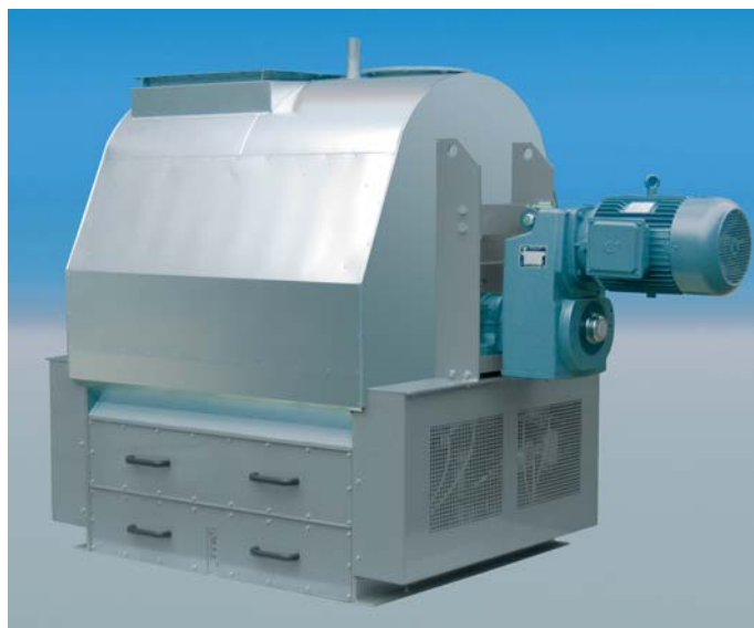
SMW 1000, isoliert

Optionen: Reinluft Trockner und Kühler, Zerhacker, Tulpenmesser, Flüssigkeitsdüsen, Dampf Düsen, Begleitbeheizung, Chargenmischer