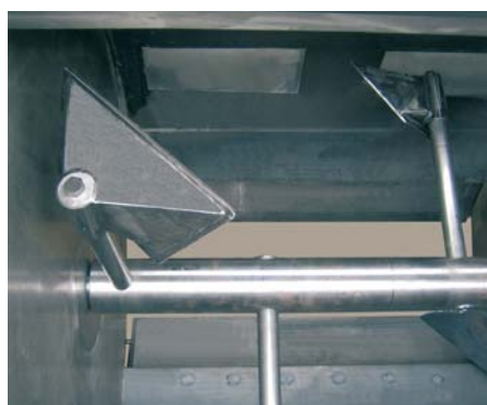
Mischerinnenraum mit Luftschlitzten und doppelter Bodenklappe